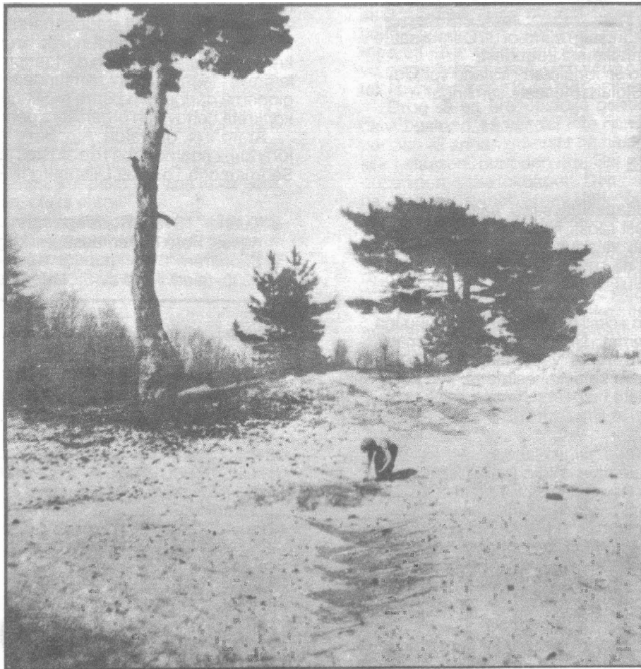
Bergsby sand

EESTIROOTSLASTE KULTUURI SELTS SAMFUNDET FÖR ESTLANDSSVENSK KULTUR